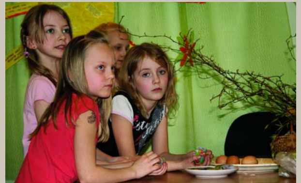
Kurai mātei četri dēli, / Tai bij četri cira kāti; Kurai mātei četras meitas, / Tai bij četri mīļi vārdi.