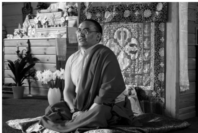
Godājamais Drupons Kunsangs Rinpoče