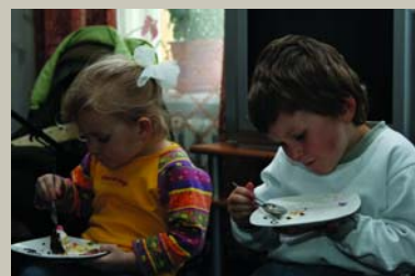
Paēduši, padzēruši, Pateiciet Dieviņam! Dieva galdis, Māras maize, Mūsu pašu sūra vara.