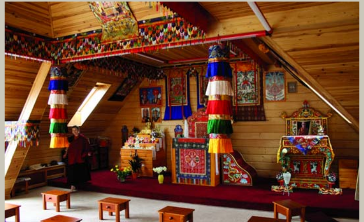
Dedziet, tautas, sveču gumi, / Puškojiet istabiņu, Tilti rīb, pieši skan, / Nu nāk mani bāleliņi. (Budistu templis Baltezerā)