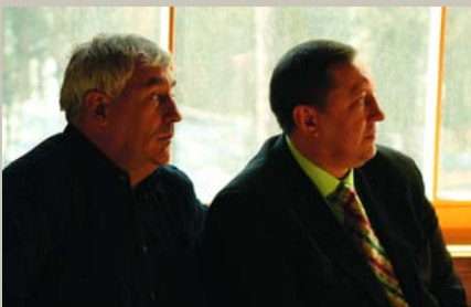
Vaj tik vien saule spīd, / Kā pa logu istabā? Vaj tik vien labu ļaužu, / Kā mēs divi bāleliņi?