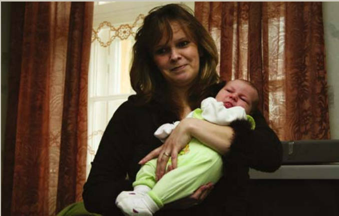
Paldies saku māmiņai / Par to vieglu dvēselīti: Nesēdējs uz akmeni / Grūtājāsi dienīnās.