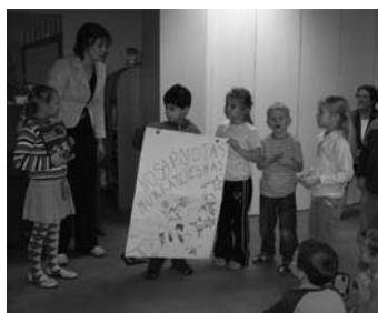
"Bērnu žūrijas 2007" dalībnieki