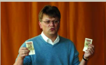
Balta kaza jūrā peld Dzeltaniem radziņiem; Rīgas kungi naudu skaita, Maliņāi stāvodami. (Tīkšanās ar Štokenbergu)