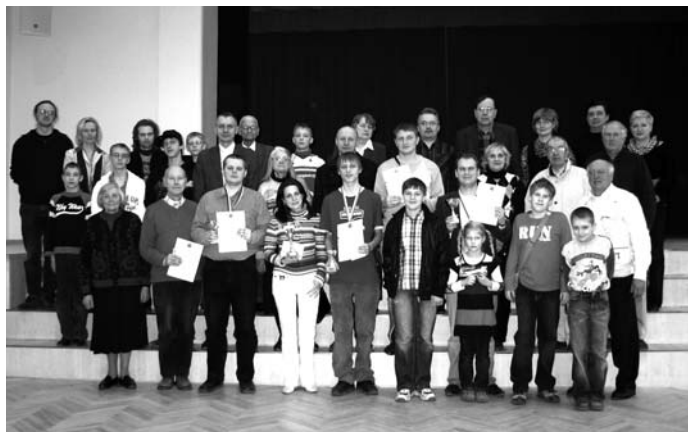
Garkalnes novada kausa izcīņas šahā dalībnieki