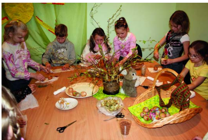
Bērni krāso olas