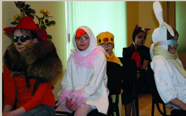
Jauns būdams pašuvos Triju zvēru kažociņ': Sīveniņa, kaķeniņa, Kazleniņa piedurkņi'. (Lieldienu uzvedums Dienas centrā)