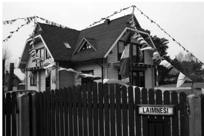
Butistu templis Baltezerā

Brauciet pa Tallinas šoseju Saulkrastu virzienā. Tikko ir šķērsota Garkalnes novada robeža, paveras gleznains skats uz Lielo Baltezeru un pirms tā – divstāvu koka namiņš ar krāsainiem karodziņiem visapkārt. Kaut novada robeža ir pārkāpta un esam jau nonākuši mūsu kaimiņu Ādažu valstībā, šī miklainā vieta varētu šķist interesanta arī Garkalnes novada iedzīvotājiem.