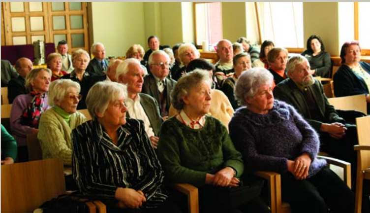
Dod, Dieviņi, tādu laimi, / Kā tiem mūsu vecakiem: Pilna klēts rudzu, miežu, / Stali bērī kumeliņi.